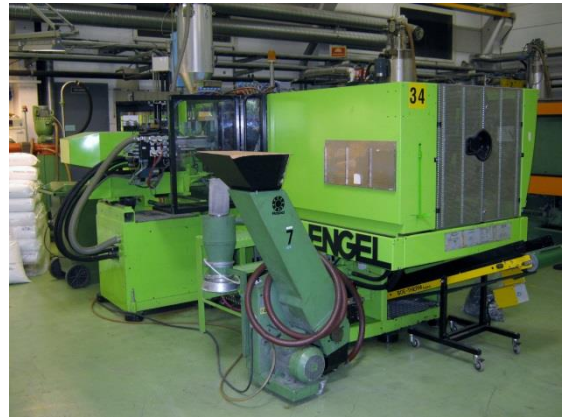
Teknisk plastprodukt 2- komp støp